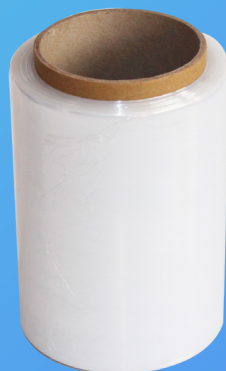
STRECH FILM MEDIDA: 6"