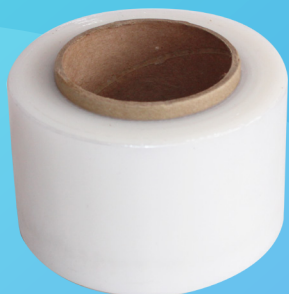
STRECH FILM MEDIDA: 3"