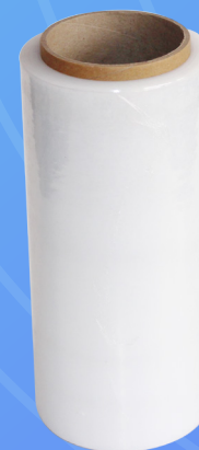
STRECH FILM MEDIDA: 9"